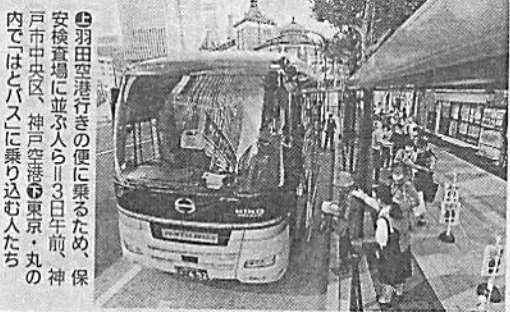
⑤羽田空港行き便に乗り乗るため、保安検査場に並ぶ人ら。13日午前、神戸市中央区、神戸空港。東京・丸の内ではバスに乗り込む人たちが

政府の観光支援事業「Go To トラベル」で東京発着旅行への割引適用が解禁されて初の週末となった3日、兵庫県空の玄関口である神戸空港（神戸市中央区）も、東京との間を往來する人たちでにぎわった。待望の旅行に新型コロナウイルス対策を徹底して臨む観光客が目立った。 (森下陽介 那谷享平)