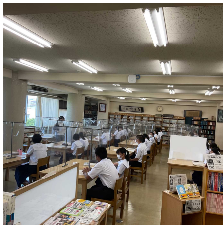
栄養 兵庫県立大学より 生物・化学の重要性 忘れないで！