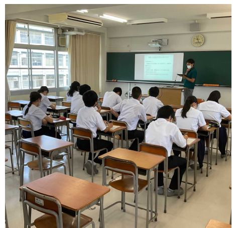
建築 積水ハウスより 少数精鋭 頑張してほしいものです