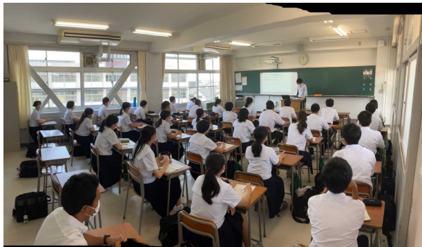
公務員 姫路市役所より かなりの希望者数です

本当に、恵まれた教師人生だと思います。こんな瞬間が、「教師やって良かった」と感じる時です。教え子に力を借りて、そこからまた次の教え子達は何かを感じてくれる。因みに、偶然ですが私の今のiパッドの壁紙は、私が転勤する際に彼女の年次が送ってくれた色紙であります。懐かしさ・感謝を改めて感じさせてもらいました。