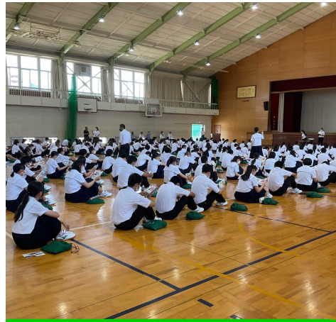
体育館移動後、 急いで整列を完了させて

3・4時間目にかけて、山陽自動車教習所、姫路市役所、網干警察署から講師を招いて、自転車安全運転講習会を行いました。期末考査終了後の週明けではありませんでしたが、真剣な表情で講習に取り組んでくれました。