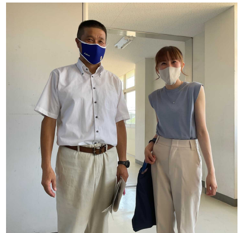
講師は 我が教え子でありました。 実に10年ぶりの再会でした

本当に、恵まれた教師人生だと思います。こんな瞬間が、「教師やって良かった」と感じる時です。教え子に力を借りて、そこからまた次の教え子達は何かを感じてくれる。因みに、偶然ですが私の今のiパッドの壁紙は、私が転勤する際に彼女の年次が送ってくれた色紙であります。懐かしさ・感謝を改めて感じさせてもらいました。