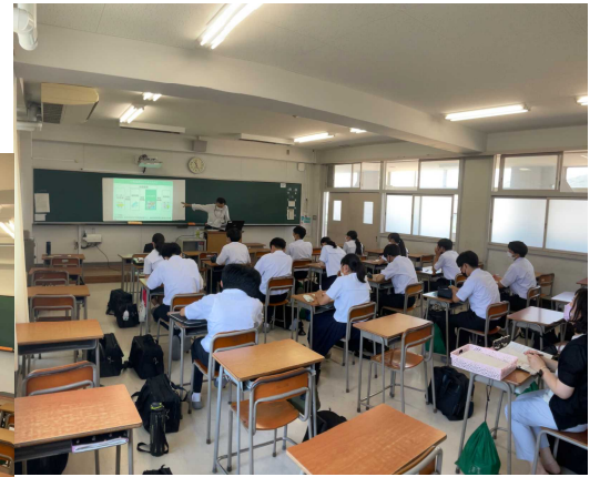
流通 すぐ側のイオン姫路大津店より