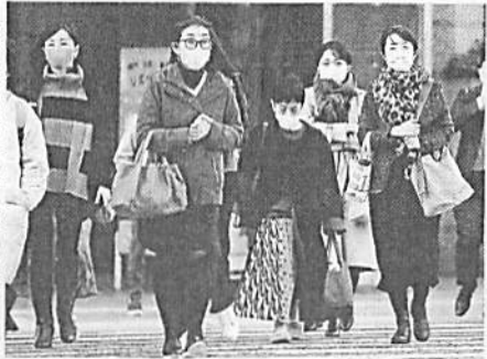
今季一番の冷え込みとなり、厚手の上着を履込みマフラーを巻いて歩く人々。4日午前、神戸市中央区元町通1