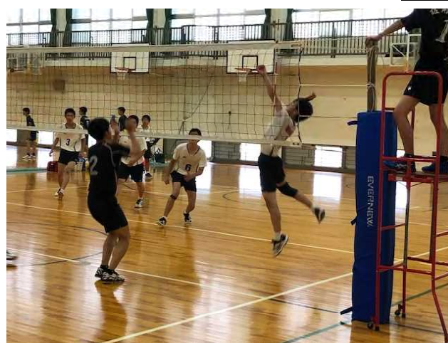
男子バレーボール部 8 月 8 日