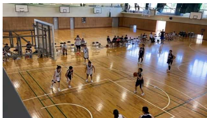
女子バスケットボール部 8 月初～中旬