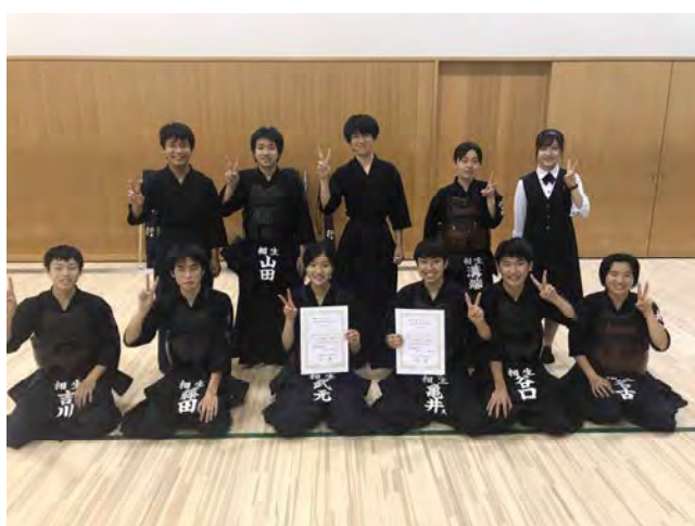
剣 道 部 8 月 3 日