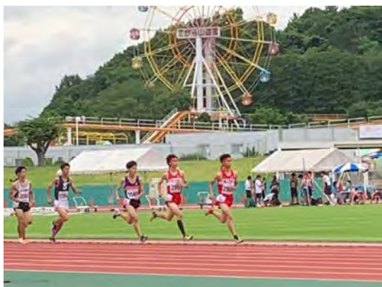
陸 上 競 技 部 7 月 2 3 ・ 2 4 日