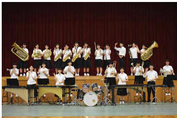
吹 奏 楽 部